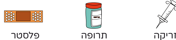
פלסטר תרופה זריקה