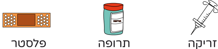
פלסטר תרופה זריקה